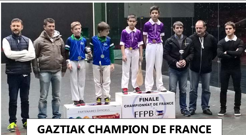
GAZTIAK CHAMPION DE FRANCE